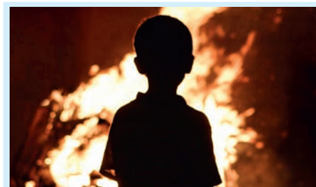
В пожаре погиб ребенок Стр. 7