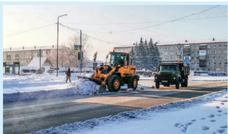
Сменили метлы на лопаты Стр. 2