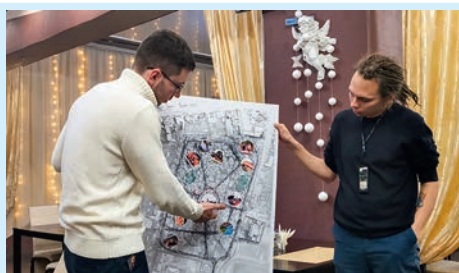
Каким будет городской сад Стр. 3